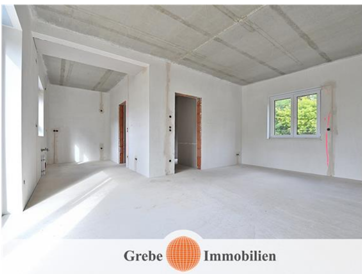
Wohn- & Essbereich