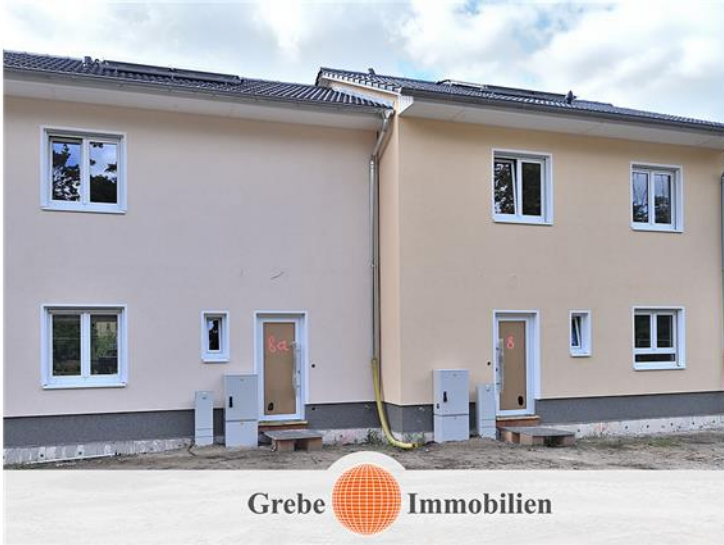
Rosa-Luxemburg-Straße 8 A