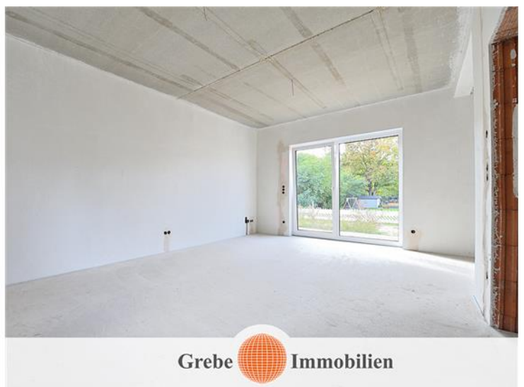
mit Austritt in den Garten