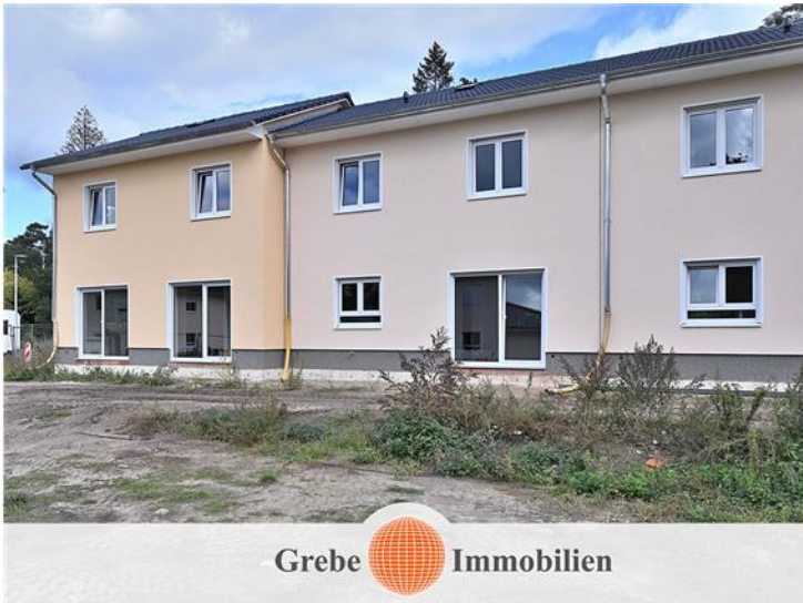
Gartenansicht Bild 2