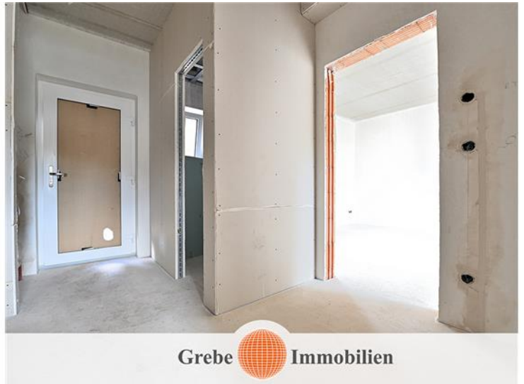
Eingangsbereich mit Gäste WC